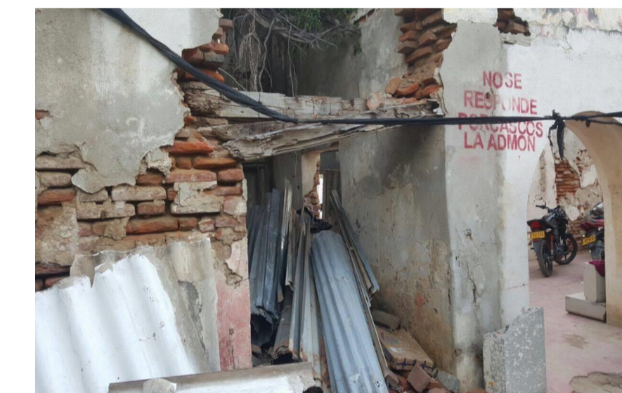
Año: 2017