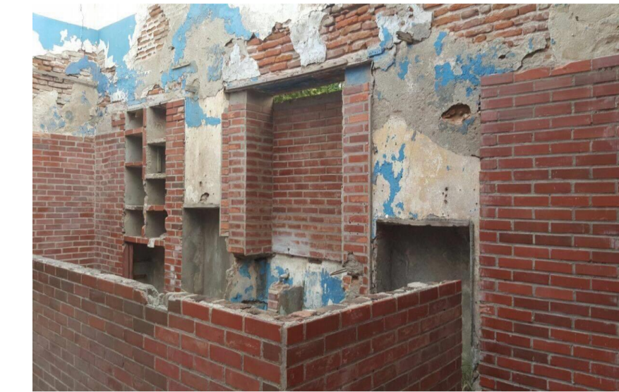
Año: 2017