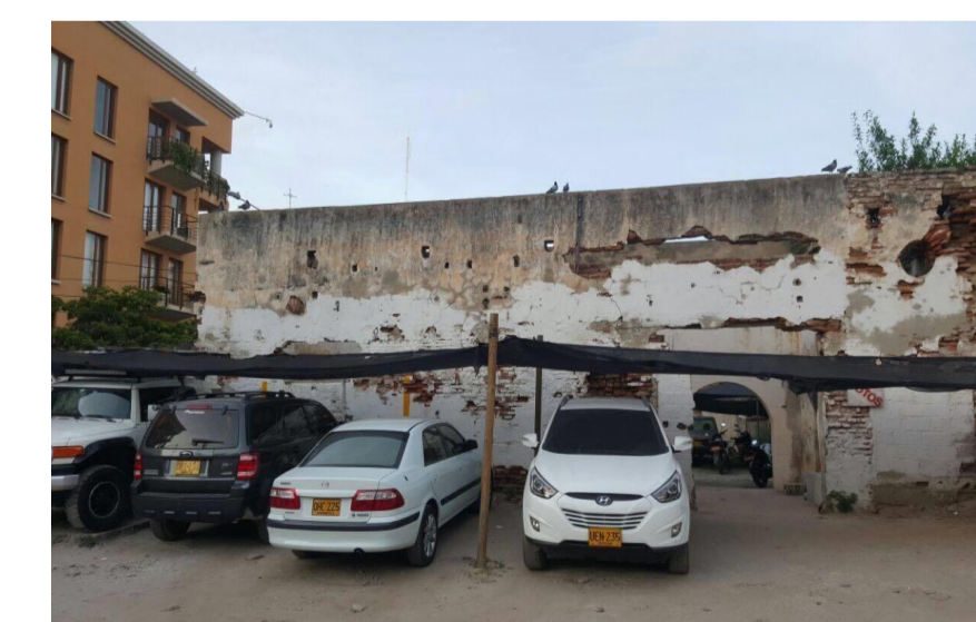
Tomada por : Emel arevalo Año: 2017

En un espacio adjunto a el area del bar se encuentra la distribucion de unos baños, y conjunto a esto están los restos de un espacio que se cuenta fue utilizado como deposito para las herramientas de la caballeriza, tambien para la cocina que a la fecha se encuentra en estado de desinteres, rescatando que sus cualidades arquitectonicas son las de una vivienda tipo claustro.