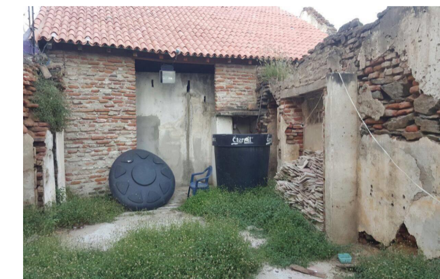
Año: 2017

En la vivienda en su area del zaguan, y area anexa a él, se evidencia la conjugacion del material entre ladrillos de adobe originales de la vivienda cuyas medidas aproximadas son de 0.14 x 0.10 x 0.30 y de ladrillos contemporaneos con el fin de mantener el espesor y la espacialidad de la casa. En la fecha de la tomar la fotografia se evidencio el deterioro y desgaste de estos muros sumandole que estas areas no estan cubiertas.