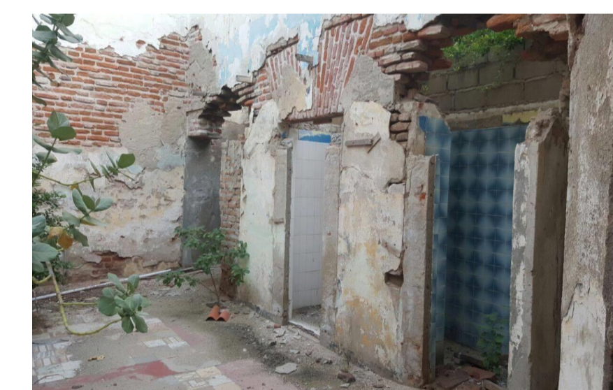
Año: 2017