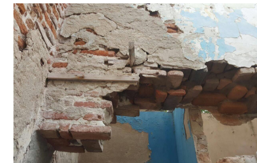
Año: 2017

Los vestigios arquitectonicos de lo que alguna ocasion fue el comedor, hoy presenta el desgaste y ruptura de los yacimientos de los muros, se implento unos baños improvisados para el uso del vigilante del parqueadero, se encuentra sellada el vano del ingreso a esta area, un dintel de madera que se duda si es el original de la vivienda, los ladrillos con sus caras descubiertas demuestran el nivel de olvido que presenta la casa .