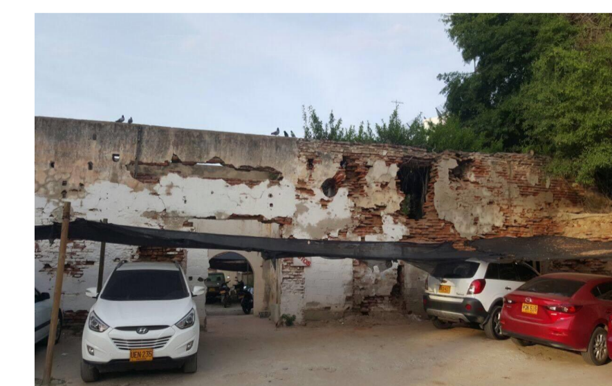
Tomada por : Emel arevalo Año: 2017

El area que era estipulado para la caballeriza es hoy en dia un parqueadero publico, donde se anclaron a sus muros polisombras y vigas en madera para cubrir los vehiculos, el otro punto encontrado es columnas en madera para el mismo uso, se adecuo una puerta metalica para controlar el ingreso y salida de estos, se presenta perforaciones y deterioro en los muros de los depositos de su antigua funcion, se aprecia su espacialidad por la conformacion de los restos.