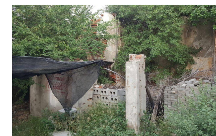
Año: 2017

En un espacio adjunto a el area del bar se encuentra la distribucion de unos baños, y conjunto a esto están los restos de un espacio que se cuenta fue utilizado como deposito para las herramientas de la caballeriza, tambien para la cocina que a la fecha se encuentra en estado de desinteres, rescatando que sus cualidades arquitectonicas son las de una vivienda tipo claustro.