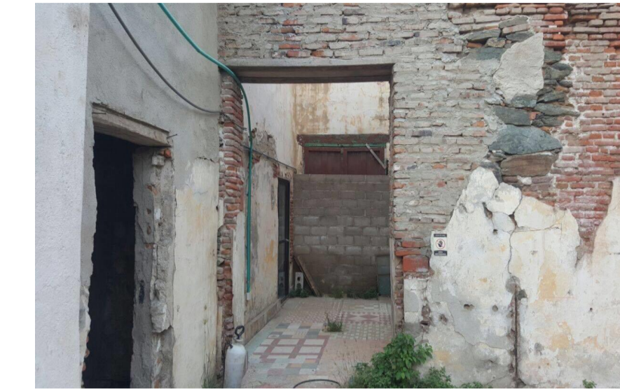
Año: 2017

En la vivienda en su area del zaguan, y area anexa a él, se evidencia la conjugacion del material entre ladrillos de adobe originales de la vivienda cuyas medidas aproximadas son de 0.14 x 0.10 x 0.30 y de ladrillos contemporaneos con el fin de mantener el espesor y la espacialidad de la casa. En la fecha de la tomar la fotografia se evidencio el deterioro y desgaste de estos muros sumandole que estas areas no estan cubiertas.