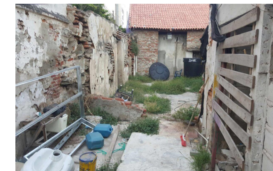
Año: 2017

Los vestigios arquitectonicos de lo que alguna ocasion fue el comedor, hoy presenta el desgaste y ruptura de los yacimientos de los muros, se implento unos baños improvisados para el uso del vigilante del parqueadero, se encuentra sellada el vano del ingreso a esta area, un dintel de madera que se duda si es el original de la vivienda, los ladrillos con sus caras descubiertas demuestran el nivel de olvido que presenta la casa .